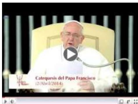
Catequesis sobre el Matrimonio