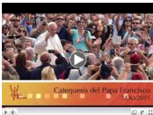
La riqueza de la familia