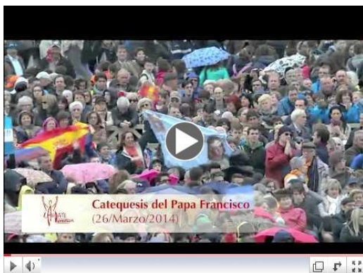
Sacramento del Orden