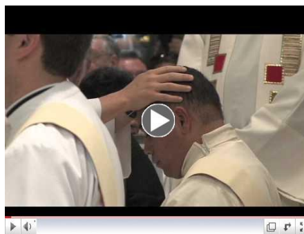
Sacramento del Orden Sacerdotal

Am I called to be a priest? Get married? Be a Religious Brother or Sister? Yes, the Lord has a plan for every person's life! Over time, through prayer and reflection, the Lord begins to reveal this plan quietly in the depths of one's heart ... Learn more