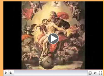
Significado de la liturgia (2)