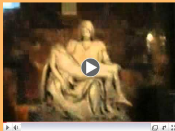
Significado de la Liturgia (1)

La sagrada Liturgia no agota toda la actividad de la Iglesia, pues para que los hombres puedan llegar a la Liturgia es necesario que antes sean llamados a la fe y a la conversión: "¿Cómo invocarán a Aquel en quien no han creído? ¿O cómo creerán en El sin haber oído de El? ¿Y cómo oirán si nadie les predica? ¿Y cómo predicarán si no son enviados?" (Rom., 10,14-15). Por eso, a los no creyentes la Iglesia proclama el mensaje de salvación para que todos los hombres conozcan al único Dios verdadero y a su enviado Jesucristo, y se conviertan de sus caminos haciendo penitencia. Y a los creyentes les debe predicar continuamente la fe y la penitencia, y debe prepararlos, además, para los Sacramentos, enseñarles a cumplir todo cuanto mandó Cristo y estimularlos a toda clase de obras de caridad, piedad y apostolado, para que se ponga de manifiesto que los fieles, sin ser de este mundo, son la luz del mundo y dan gloria al Padre delante de los hombres. (Cont. Sacrosanctum Concilium, 9)