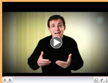
La liturgia en la Iglesia

Envíanos sus sugerencias a: omh@richmonddiocese.org Sujeto: Curso de Liturgia en línea