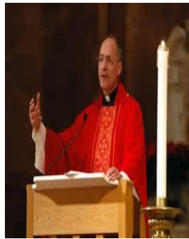
Homily in Spanish

Canto: Entrada- click Canto: Ofertorio- click Canto: Comunión - click Canto: Salida - click