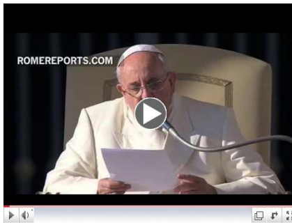
El Papa nos habla sobre Ntra. Sra. de Guadalupe