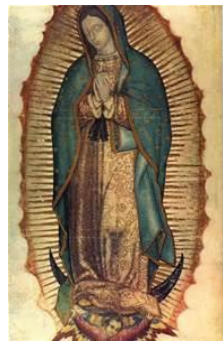
Lecturas Misa Virgen de Guadalupe. Spanish / English

The contents of this session support the Mass of Our Lady of Guadalupe. You can find: Readings, Homily, Booklet for the Mass (Ciclo A), and Songs and Music.